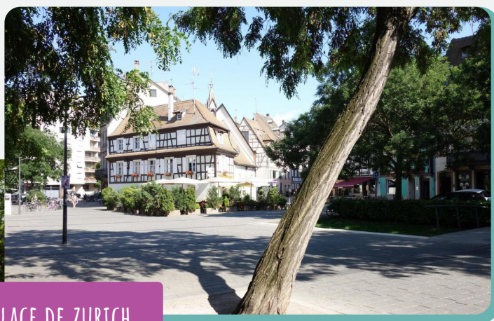
PLACE DE ZURICH