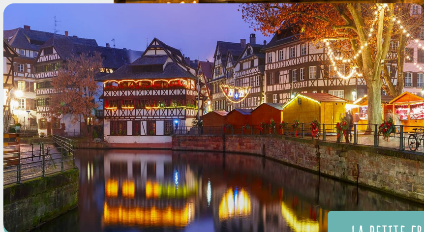
LA PETITE FRANCE