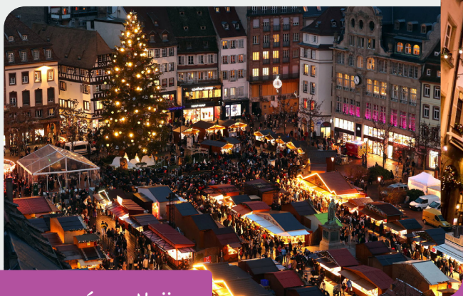
LES MARCHÉS DE NOËL