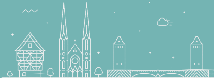
LA CATHÉDRALE NOTRE-DAME